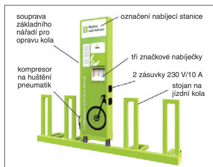
Nabíjecí stanice pro kola od společnosti ejoin, s. r. o.

Vnější provedení stanice (krytí IP54) zaručuje odolnost proti změnám teploty a nepříznivým povětrnostním podmínkám a barevnou stálost. Na podsvícené konstrukci je možné zobrazit informace o cyklostezce, mapy nebo reklamy. Součástí nabíjecí stanice mohou být: